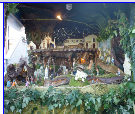
Presepe n. 10: Renato Chemello via Valles, 11