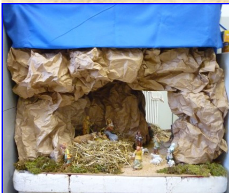
Presepe della Scuola primaria Cabianca Strada del Pasubio, 238