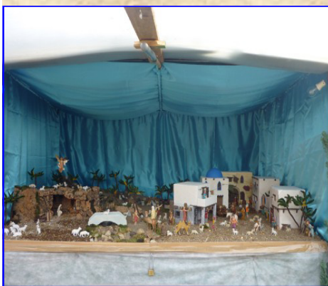
Presepe n. 19: Famiglie di Strada Ponte del Bò