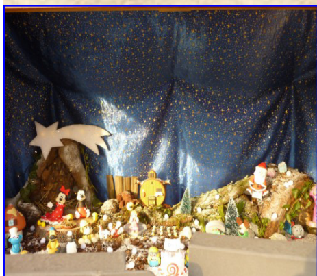
Presepe n. 14: Ometto Valentina via Rolle, 30