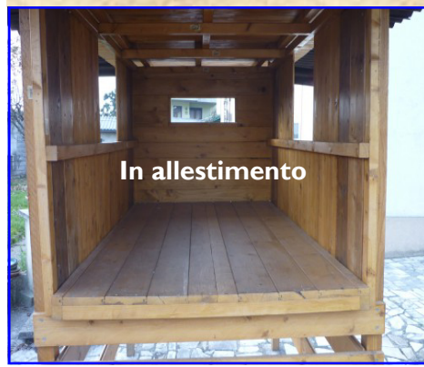
Presepe n. 16: Grammatica Cristian strada di Lobia, 21