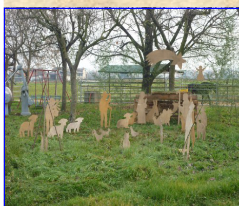
Presepe n. 20: Ponzio Mirko e Silvia Strada di Lobia, 6