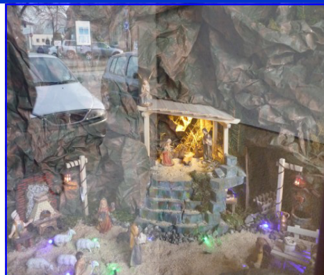
Presepe n. 13: Gruppo Giovani ACR Centro giovanile di Maddalene