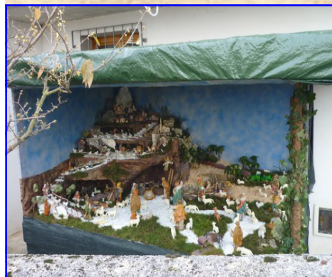
Presepe n. 17: Cattani Enrico strada di Lobia, 61