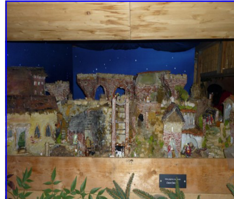
Presepe n. 6: Cazzola Luca Portici ex convento Maddalene