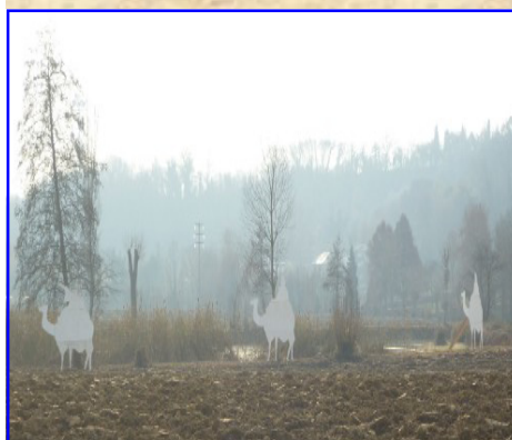
Presepe n. 5: Tracanzan R. e Cazzola L. Località Boja