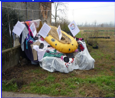
Presepe n. 11: Matteo Belpinati via Cereda, 97