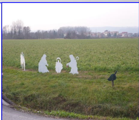
Presepe n. 18: Gruppo Alpini Penne Mozze Maddalene - Str. Ponte del Bò