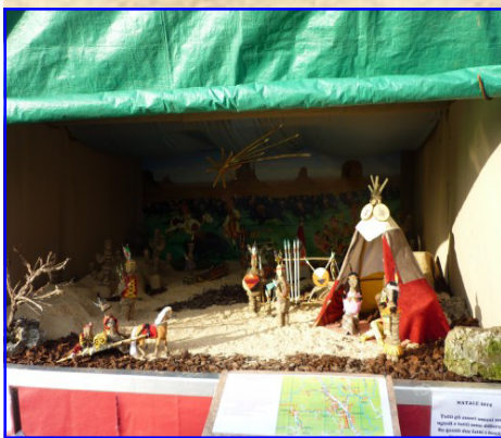
Presepe n. 15: Famiglie di via Rolle Via Rolle, 168