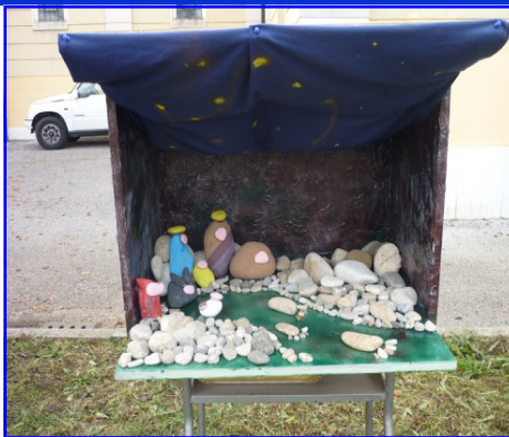
Presepe n. 12: Gruppo Scout Vicenza 3 Via Cereda