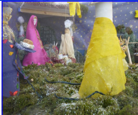
Presepe n. 2: Scuola dell'Infanzia di Maddalene