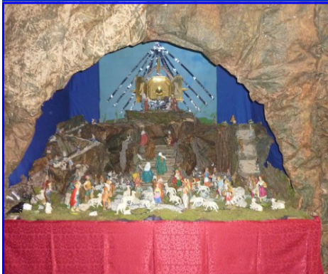
Presepe n. 1: Chiesa parrocchiale di Maddalene