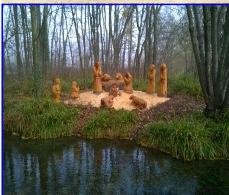
Presepe n. 7: Gruppo Scultori Risorgive Seriola