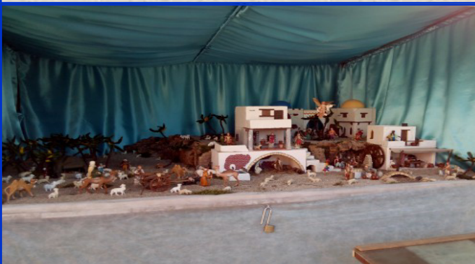
Presepe n. 19 Strada Ponte del Bò Autori: Famiglie Strada Ponte del Bò