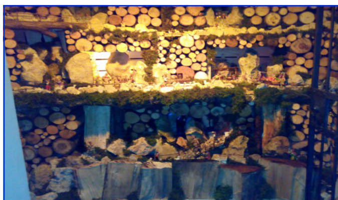
Presepe n. 4 Strada Beregane, 52 Autore: Tracanzan Renzo