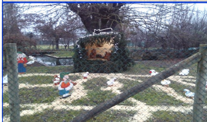
Presepe n. 8 Strada San Giovanni, 49 Autori: Famiglie di Strada San Giovanni