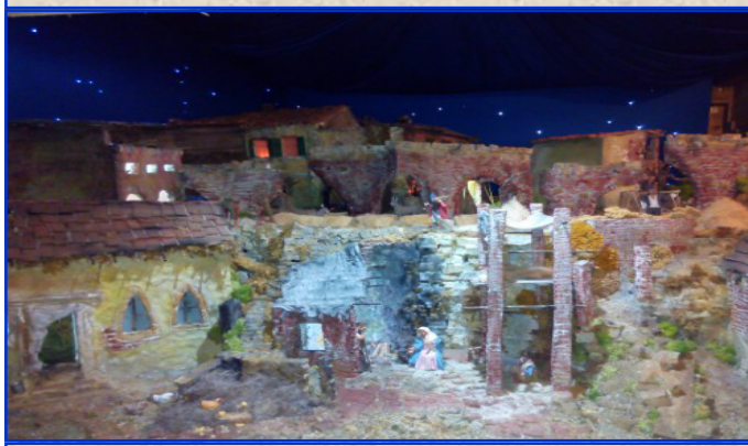
Presepe n. 6 Portici ex convento di Maddalene Autore: Cazzola Luca