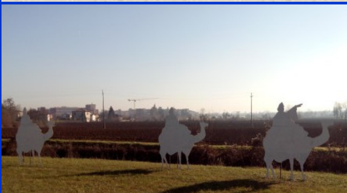
Presepe n. 18 Strada di Lobia (dopo il ponte sull'Orolo) Autori: Gruppo Alpini Penne Mozze di Maddalene