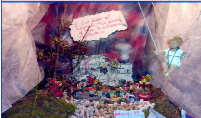
Presepe n. 9 Strada San Giovanni, 44 Autori: Famiglie Speggorin