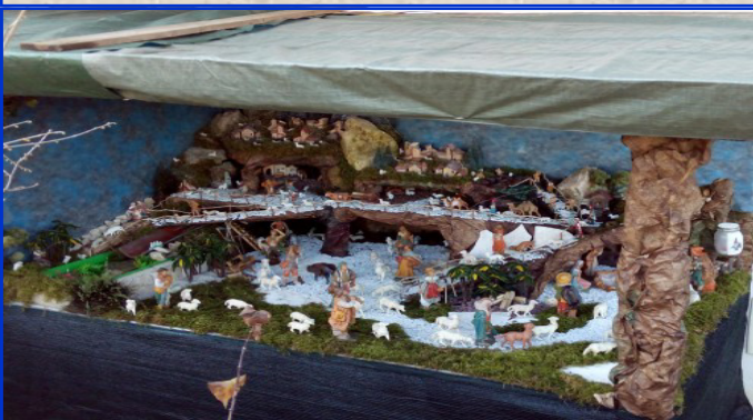
Presepe n. 17 Strada di Lobia, 61 Autore: Cattani Enrico