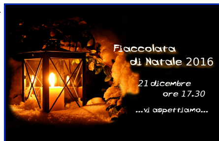
Fioccolata di Natale 2016 21 dicembre ore 17.30 ...vi aspettiamo...

► Sabato 24 dicembre all'uscita delle SS. Messe presso le chiese di S. Carlo (Villaggio del Sole) e S. Bertilla, tradizionale distribuzione di dolci e cioccolata calda e vin brulé.