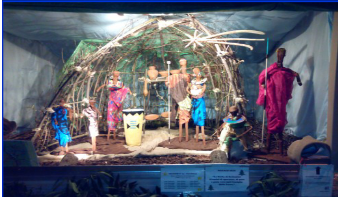
Presepe n. 15 Via Rolle, 168 Autori: Famiglie di Via Rolle