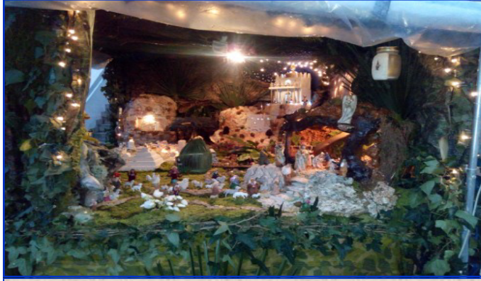
Presepe n. 10 Via Valles, 11 Autore: Chemello Renato