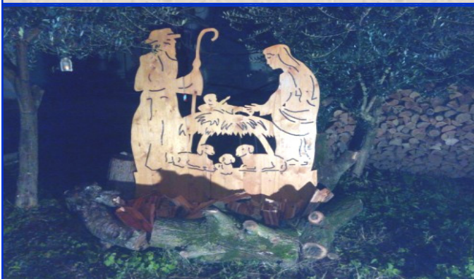
Presepe n. 11 Via Cereda, 92 (Canonica di Maddalene) Autori: Tracanzan R., Cazzola L., Equizi M.

Il Comitato per il Re Monumentale di presepe