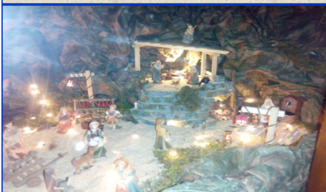
Presepe n. 13 Centro Giovanile di Maddalene Autori: Gruppo ACR Maddalene