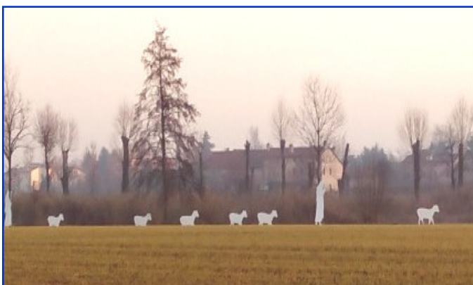
Presepe n. 5 Strada Maddalene - loc. Boja Autori: Tracanzan R., Cazzola L. e Equizi M.