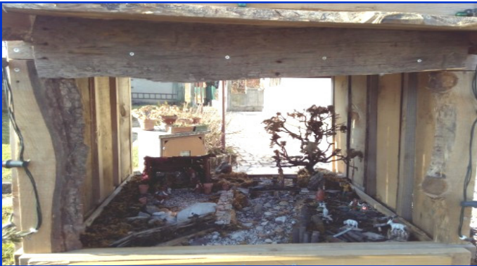
Presepe n. 16 Strada di Lobia, 21 Autore: Grammatica Cristian