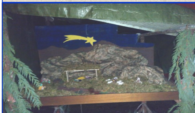
Presepe n. 12 Via Cereda (a fianco della chiesa parrocchiale) Autori: Gruppo Scout Vicenza 3