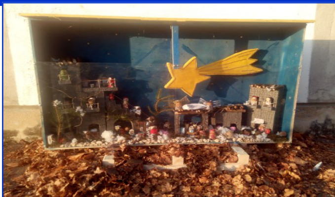
Presepe n. 2 Scuola dell'Infanzia San Giuseppe di Maddalene Autori: Genitori bambini della scuola