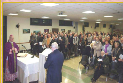
Nelle foto, due momenti della celebrazione liturgica dello scorso anno con il vescovo Beniamino Pizziol dai Saveriani

Dopo la grande manifestazione del 10 aprile a Bassano per il 40° della fondazione della Sezione Provinciale (vedi Rivivere 52 www.aidovicenza.it ), sarà un'altra buona occasione per rilanciare il messaggio per informare e sensibilizzare la comunità intera sull'importanza della donazione di organi.