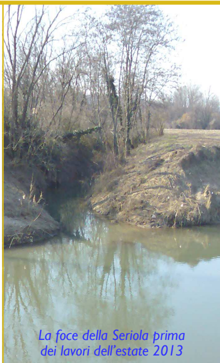
La foce della Seriola prima dei lavori dell'estate 2013