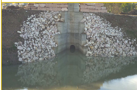
Ecco come si presenta la foce della Seriola dopo i lavori dell'estate 2013

A corredo di questo servizio pubblichiamo una serie di foto che intendono mettere a confronto la situazione prima dei lavori eseguiti l'estate scorsa e l'attuale situazione a lavori ultimati.