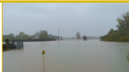
Una foto di località Do Botti del 1° novembre 2010 alle ore 16,00 lato Bacchiglione