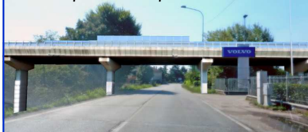
Una elaborazione grafica del Comitato di come potrebbe impattare il viadotto