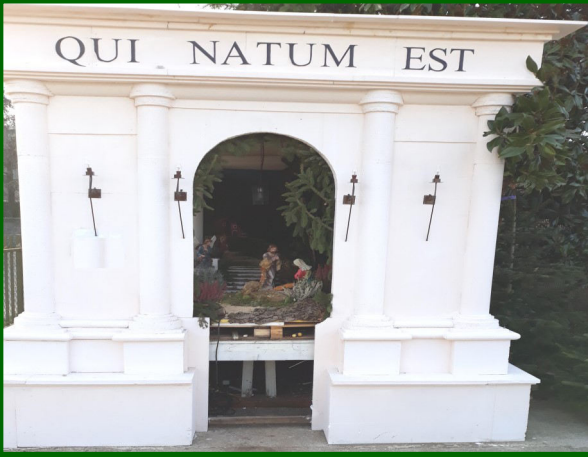
Presepe n. 4 - Via Falzarego, 10