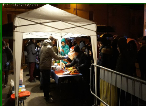
Vita dei Gruppi. Quella di Maddalene