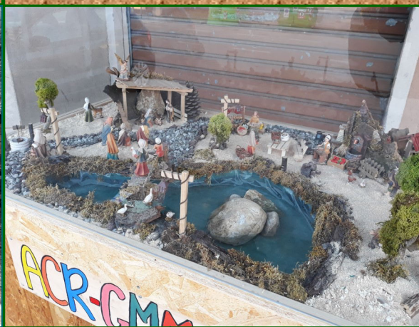
Presepe n. 15 - Centro P.le Maddalene