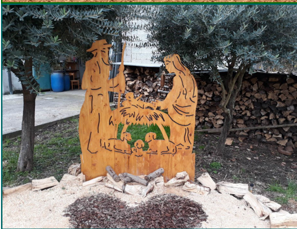
Presepe n. 14 - Via Cereda, 92