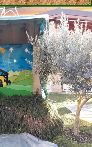
da S. Giovanni, 79