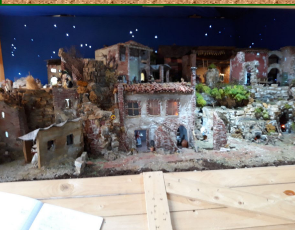
Presepe n. 8 - portici Maddalene V.