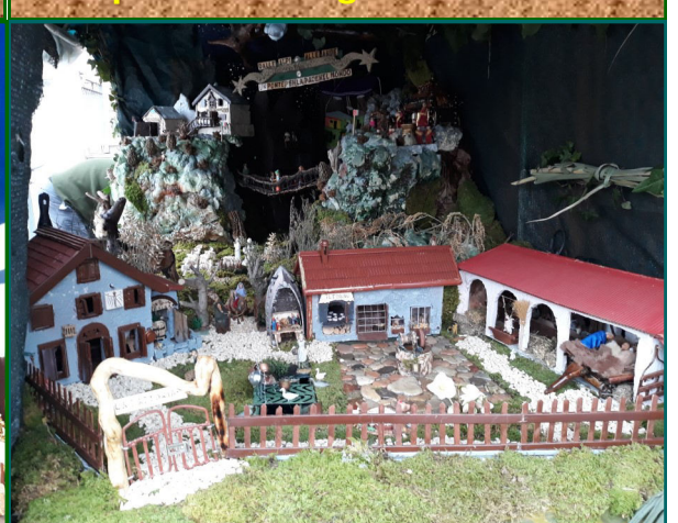
Presepe n. 13 - Via Valles, 11