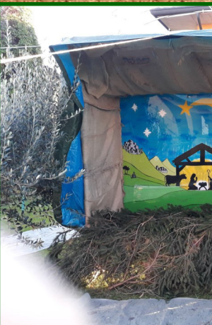
Presepe n. 11 - Strada