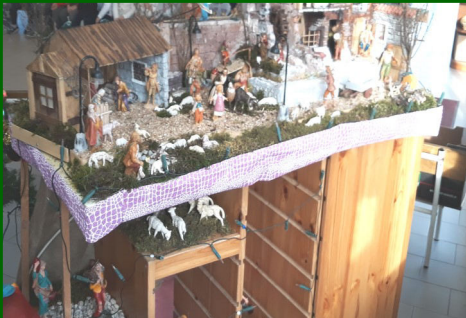
Presepe n. 2/a - Scuola dell'Infanzia di Maddalene