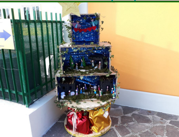
Presepe n. 2 - Scuola dell'Infanzia