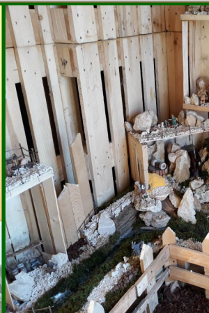
Presepe n. 3 - Strada