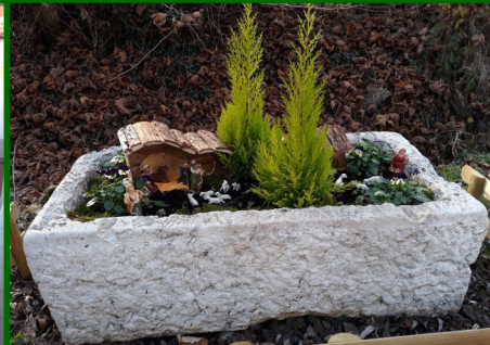
Presepi mini di strada Beregane