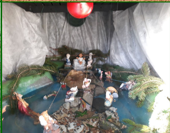
Presepe n. 10/a - Str. S. Giovanni, 44