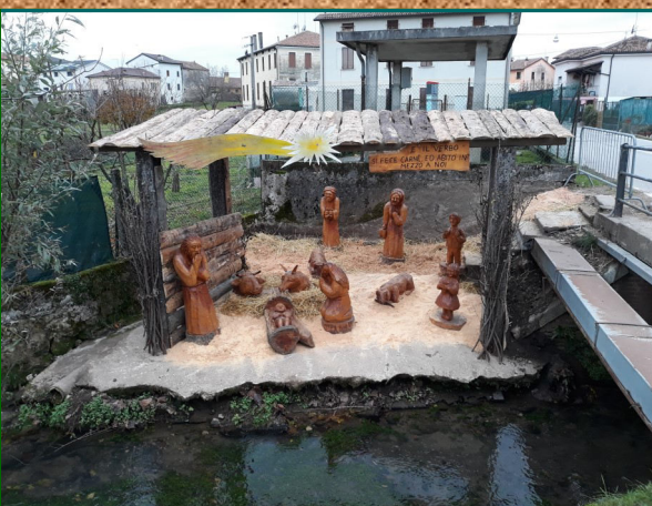
Presepe n. 6 - Lavatoi Maddalene V.