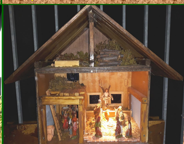
Presepe n. 17 - Strada di Lobia, 21