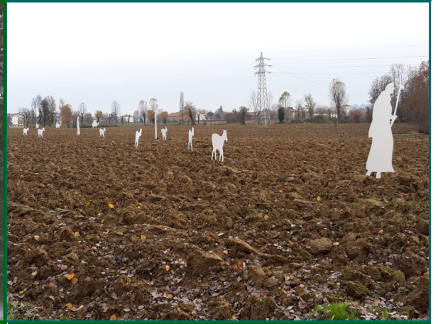
Presepe n. 5 - Ciclabile di Maddalene