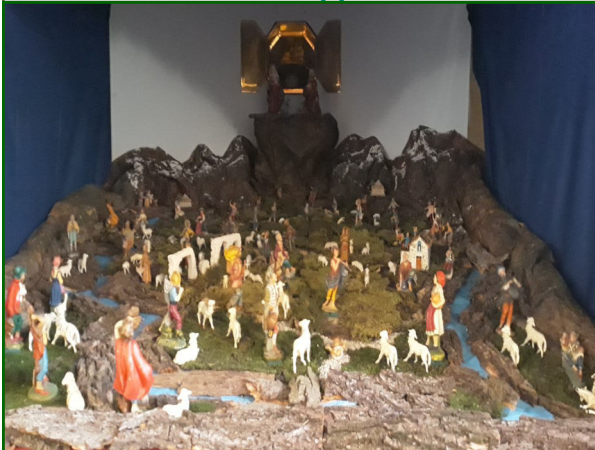
Presepe n. 1 - Oratorio parrocchiale