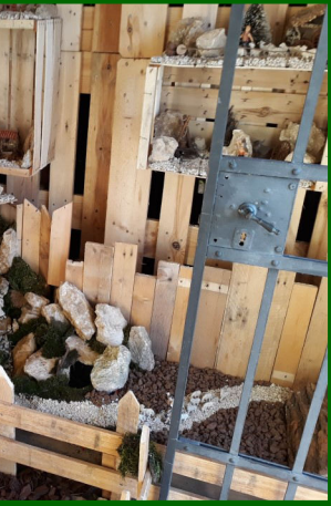
da Beregane, 52