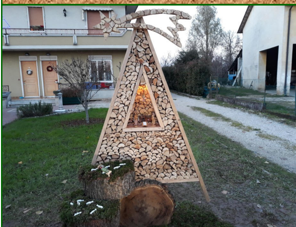
Presepe n. 5/a - Strada Maddalene, 80