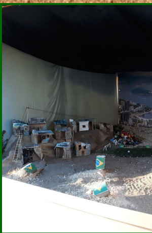
Presepe n. 16 - via