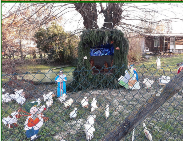
Presepe n. 10 - Strada S. Giovanni, 49