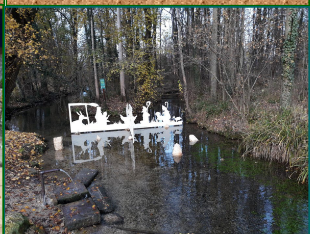
Presepe n. 9 - Risorgive Seriola