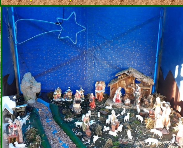
Presepe n. 12 - Via Cadibona, 8/d