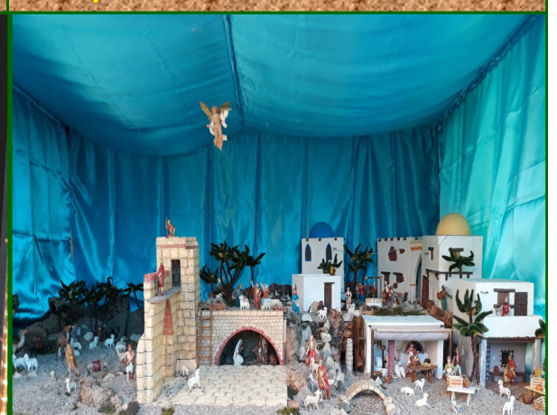
Presepe n. 18 - Strada Ponte del Bo