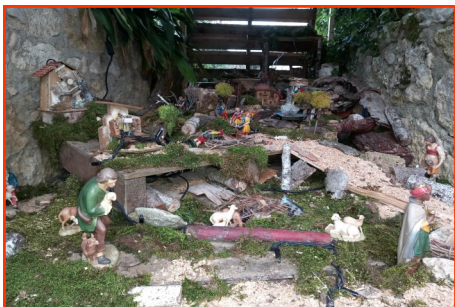
Presepe n. 7 Autore: Famiglia Bono Alberto