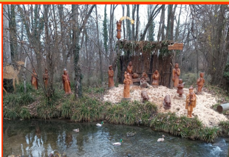
Presepe n. 22 Autori: Bettin, Campana, Simeoni, Zilio, Bassanello