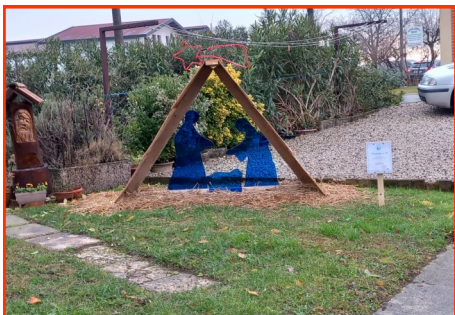
Presepe n. 37