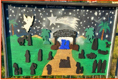
Presepe n. 29 Autore: Condominio Maddalene