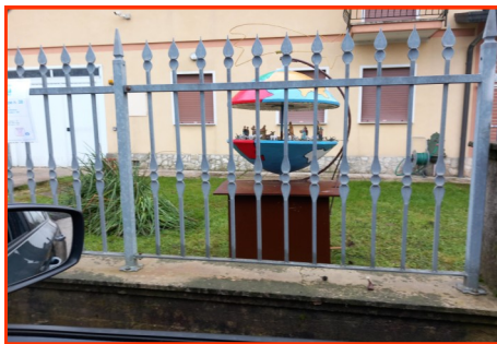
Presepe n. 38