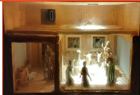
Presepe n. 33