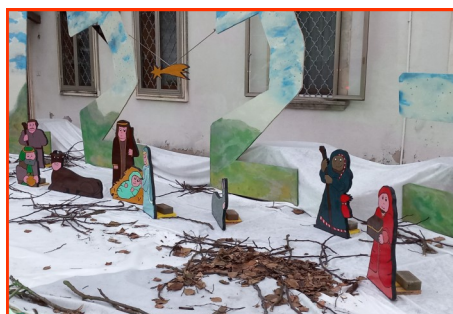
Presepe n. 14 Autore: don Roberto e don Antonio