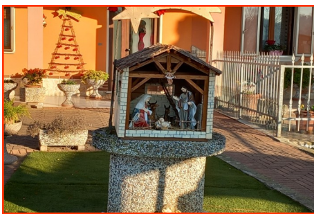
Presepe n. 28 Autore: Battilana Monica