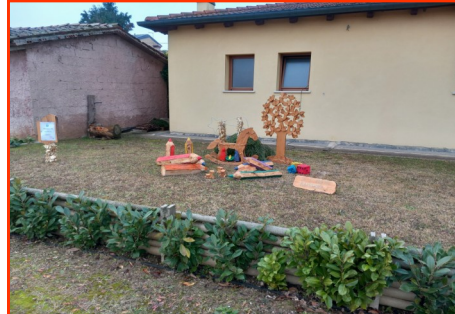
Presepe n. 36