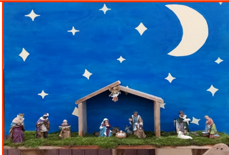
Presepe n. 32