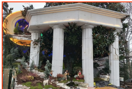
Presepe n. 8 Autore: Garzon Martino - Green Park