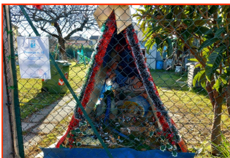
Presepe n. 16 Autore: Ceccon Giuseppe e Celeste