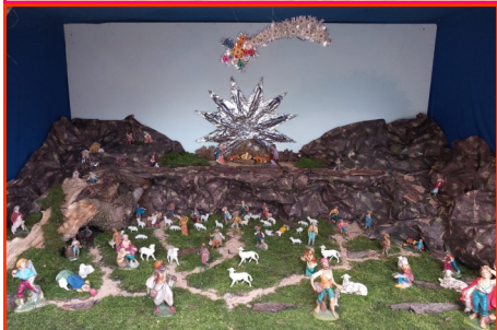
Presepe n. 1 Autore: Vidotto Ilario