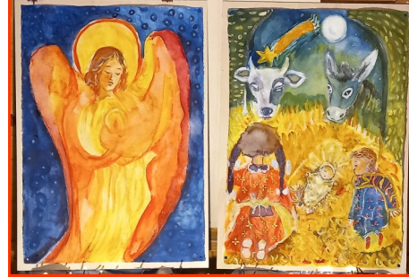
Presepe n. 30 Autori: Alunni Scuola J. Cagianca