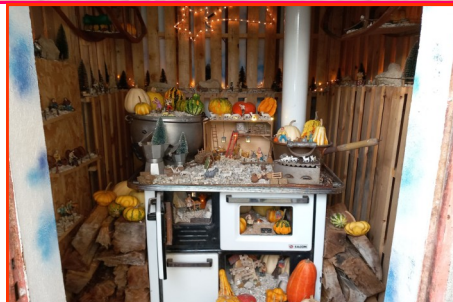
Presepe n. 2 Autori: Tracanzan, Cazzola, Equizi