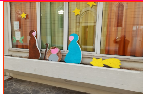
Presepe n. 3 Autore: Scuola dell'Infanzia S. Giuseppe