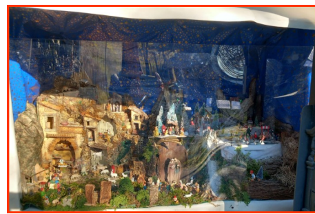
Presepe n. 18 Autore: Famiglie Pasini - Bortolan