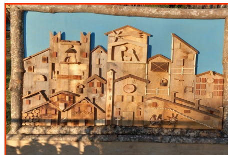
Presepe n. 27 Autore: Meneguzzo Tiziano e Irene