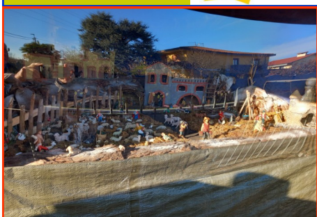
Presepe n. 19 Autore: Famiglia Speggiorin Tiziano