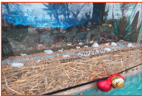
Presepe n. 40