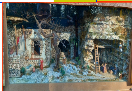
Presepe n. 20 Autore: Famiglia Covolo Paola