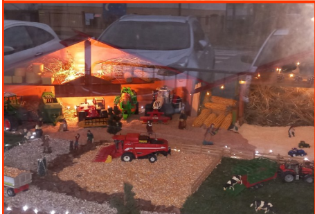
Presepe n. 31