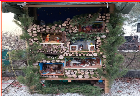
Presepe n. 5 Autore: Trecco Danilo