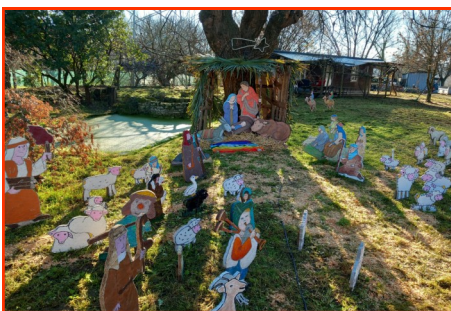
Presepe n. 17 Autore: Famiglie di Strada S. Giovanni