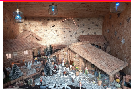
Presepe n. 6 Autore: Tracanzan Renzo e Cristian