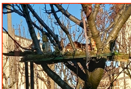
Presepe n. 26 Autore: Magnani Vittoria