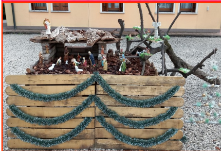
Presepe n. 4 Autore: Rossato Giuseppe