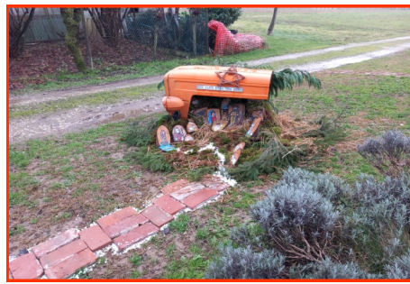
Presepe n. 39