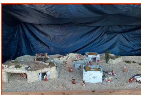
Presepe n. 25 Autori: Mussolin Pietro e Alberto