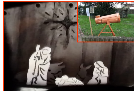
Presepe n. 12 Autore: Ferrarotto Davide