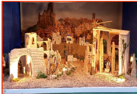
Presepe n. 11 Autore: Famiglia di via Rolle