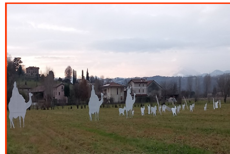
Presepe n. 9 Autore: Gruppo Alpini di Maddalene