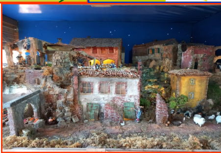
Presepe n. 23 Autore: Cazzola Luca e Carlotta