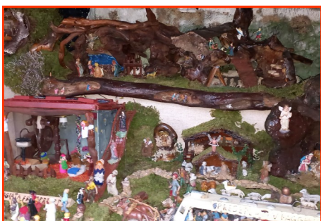
Presepe n. 13 Autore: Chemello Renato