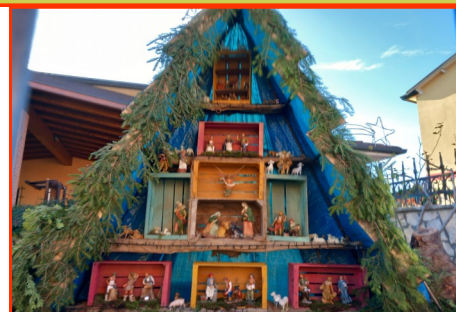
Presepe n. 21 Autore: Famiglia Canale Franco, Monica