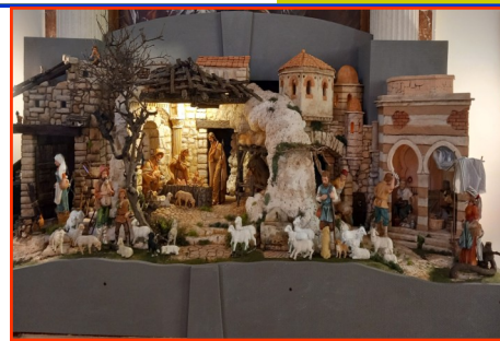
Presepe n. 24 Autore: Dilda Fabrizio