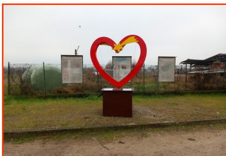
Presepe n. 35