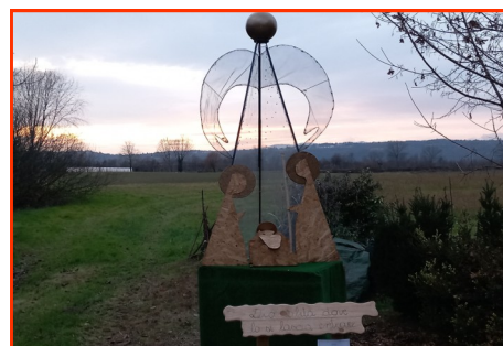
Presepe n. 15 Autori: Amici di via Cereda